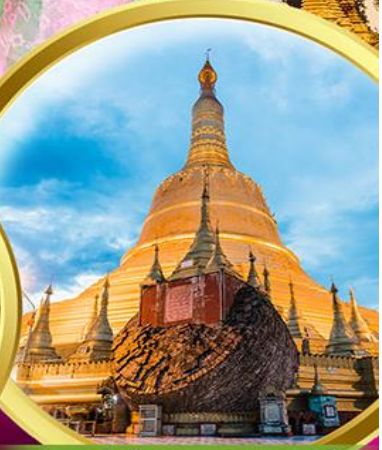
เจดีย์ชเวดากอง

พิเศษ!! กุ้งแม่น้ำเผาถ่านละ 1 ตัว + บุฟเฟ่ต์HOTPOT