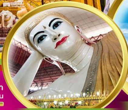
พระนอนตาหวาน