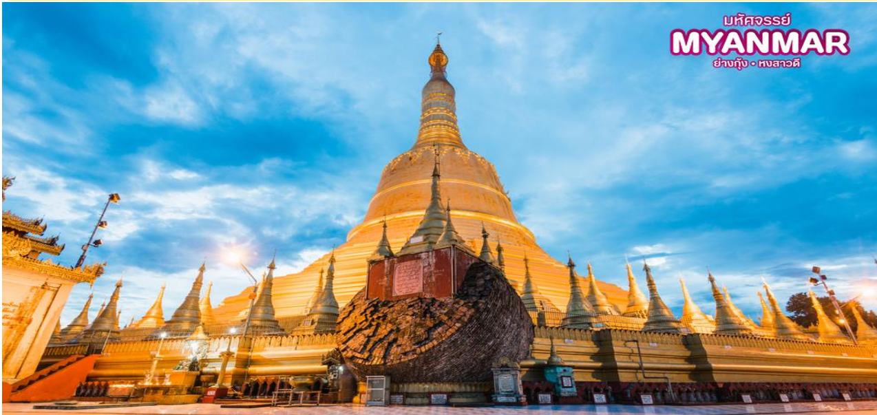
บริษัทจรรยา MYANMAR ย่างกุ้ง • พะโลว์

เจดีย์เก่าแก่คู่บ้านคู่เมืองและเป็น 1 ใน 5 มหา บูชาสถานสิ่งศักดิ์สิทธิ์ของพม่า ซึ่งเจดีย์นี้ สมเด็จพระนเรศวรมหาราช ของไทย เคยมาสักการะ เป็นศิลปะที่ผสมผสานระหว่างศิลปะพม่าและศิลปะของมอญได้อย่างกลมกลืน มีจุดอธิษฐานที่ศักดิ์สิทธิ์อยู่ตรงบริเวณยอดฉัตรที่ตกลงมาเมื่อปี พ.ศ. 2473 ด้วยน้ำหนักที่มหาศาล ตกลงมายังพื้นล่างแต่ยอดฉัตร กลับยังคงสภาพเดิมและไม่แตกกระจายออกไป เป็นที่ร่ำลือถึงความศักดิ์-สิทธิ์โดยแท้ นมัสการ ณ จุดอธิษฐานอันศักดิ์สิทธิ์ และสามารถนำรูปไปค้ากับยอดของเจดีย์องค์ที่หักลงมาเพื่อเป็นสิริมงคล ซึ่งเปรียบเหมือนดั่งคำจูนชีวิตให้เจริญรุ่งเรืองยิ่งขึ้นไป