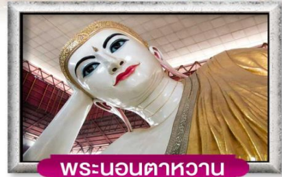
พระนอนตาหวาน