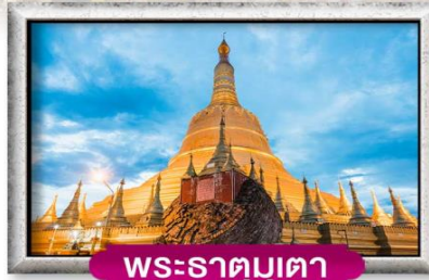
พระธาตุมุเตา