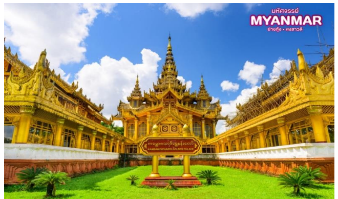
บริษัทจรรยา MYANMAR ย่างกุ้ง • พะโลว์

ซึ่งเพิ่งเริ่มขุดค้นและบูรณปฏิสังขรณ์เมื่อปี พ.ศ.2533 จากซากปรักหักพังที่ยังหลงเหลืออยู่ ทำให้สันนิษฐานได้ว่าโบราณสถานแห่งนี้เป็นที่ประทับของ พระเจ้าบุเรงนอง ท่านผู้ที่ได้รับคำสรรเสริญว่าเป็น ผู้ชนะสิบทิศ และเป็นที่ประทับของ