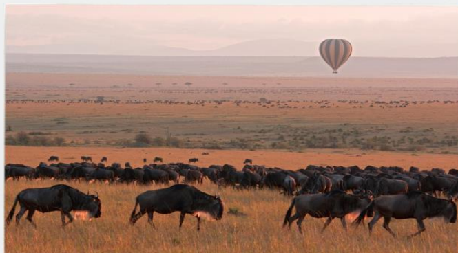
Masai Mara National Park

หลังจากนั้นนำท่านรับประทานอาหารค่ำ และพักผ่อนตามอัธยาศัย