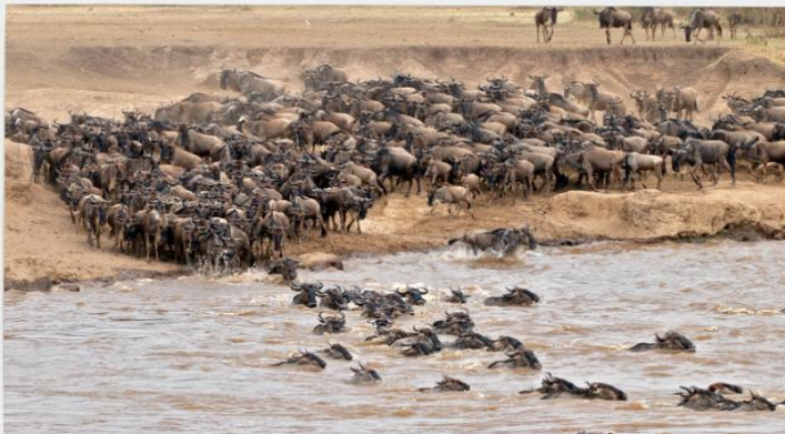
Gazelle in Mara River

หลังจากนั้นนำคณะออกเดินทางไปยังอุทยานแห่งชาติมาไซมาร่า เพื่อตามหา THE BIG FIVE ส่องสัตว์ถึง 5 แห่งป่าแอฟริกาใต้ซึ่งประกอบด้วยสิงโต, เสือเลี้ยงลูก, ควาย, และช้าง หลังจากนั้นรับประทานอาหารเย็น และพักผ่อน ณ ที่พักในเขตอุทยาน