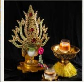
ตระกอลตา ฤาดีคาเฟ่