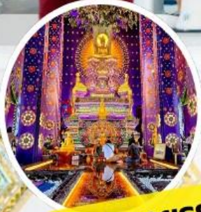
วัดสวายอยุธยา