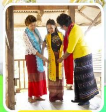
ชุมชนไทรน้อย