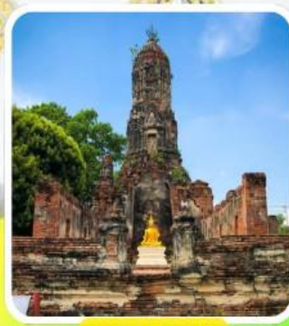
วัดเชิงท่า