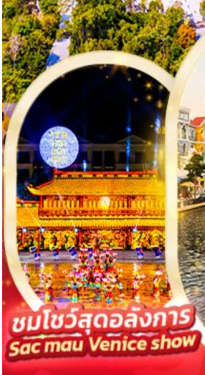
ชมโชว์สุดอลังการ Sac mau Venice show