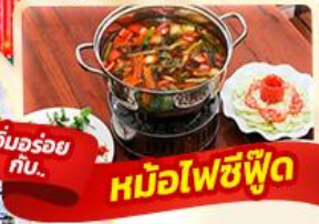
อิ่มอร่อย กับ... หม้อไฟซีฟู้ด