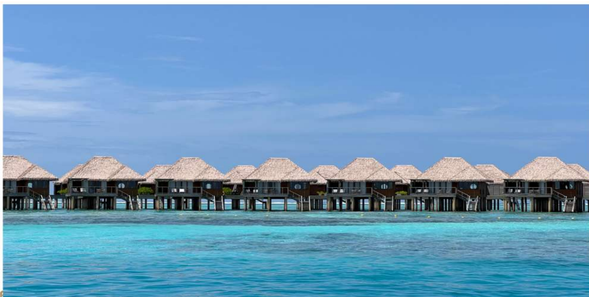
เจียบสงบ

รีสอร์ทระดับ 5 ดาวสุดพิเศษที่ให้คุณได้สัมผัสประสบการณ์สุดประทับใจที่มีเอกลักษณ์เฉพาะตัวคือความ เจียบสงบและความสะดวกสบายท่ามกลางบรรยากาศชายหาดสุดเก๋ ด้วยน้ำทะเลสีฟ้าใส ทรายสีขาว และ สวนปะการัง